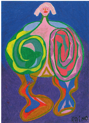
Gennaro Raimo, Ich liebe dich auch so, 2017, Ölkreide auf Papier, 70 x 50 cm, Fotos: Lorenz Trapp